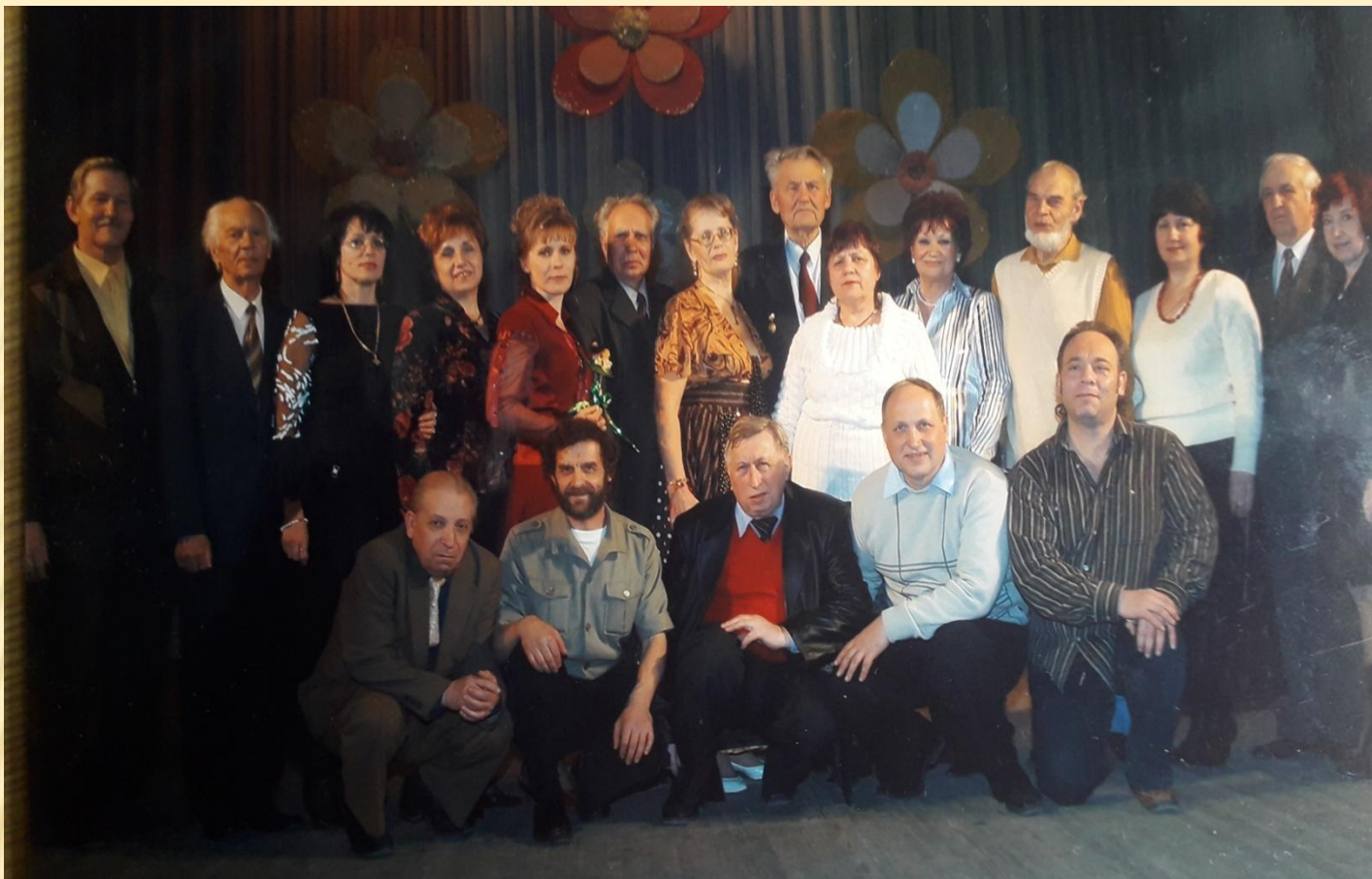
Таганрогское городское литературное объединение «Чайка»